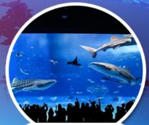
ดูราชมือควาเรียม