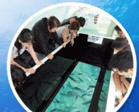
ส่องเรือกระเจก