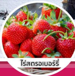
ไร่สตรอเบอร์รี่