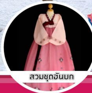
สวมชุดฮันบก