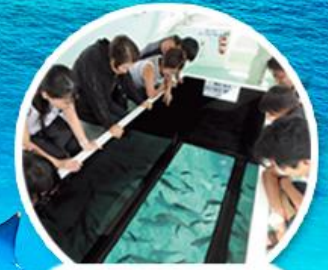
ล่องเรือกระจก

ล่องเรือกระจก ชมประภาคารใต้ท้องทะเลสุดงดงาม ชมพิพิธภัณฑ์สัตว์น้ำ จรวดมือควาเรียม ช้อปปิ้งจุใจย่าน ถนนโคคุไซ