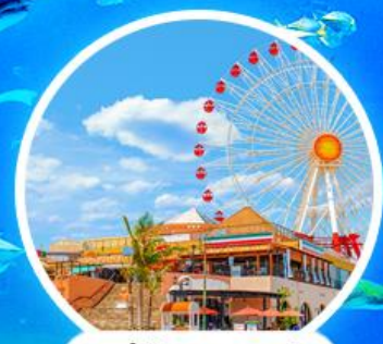
หมู่บ้านอเมริกัน